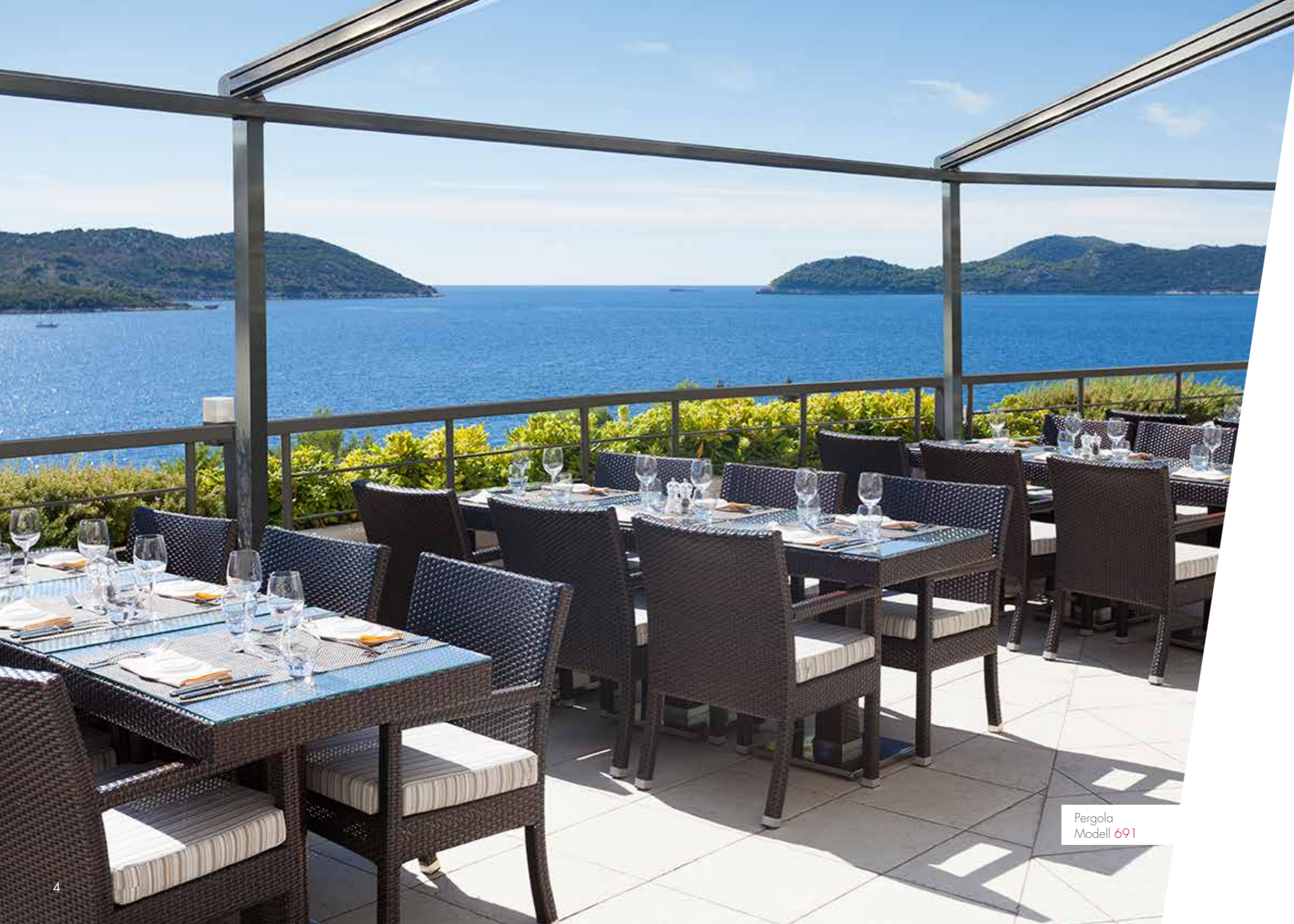
Pergola Modell 691

Das moderne, zeitlose Design der Pergola setzt optische Highlights an Fassaden oder auf Außenflächen und integriert sich perfekt in die Umgebung. Die geradlinige Rahmenkonstruktion wertet Ihren Außenbereich auf und kombiniert eine formschöne Optik mit höchster Funktionalität.